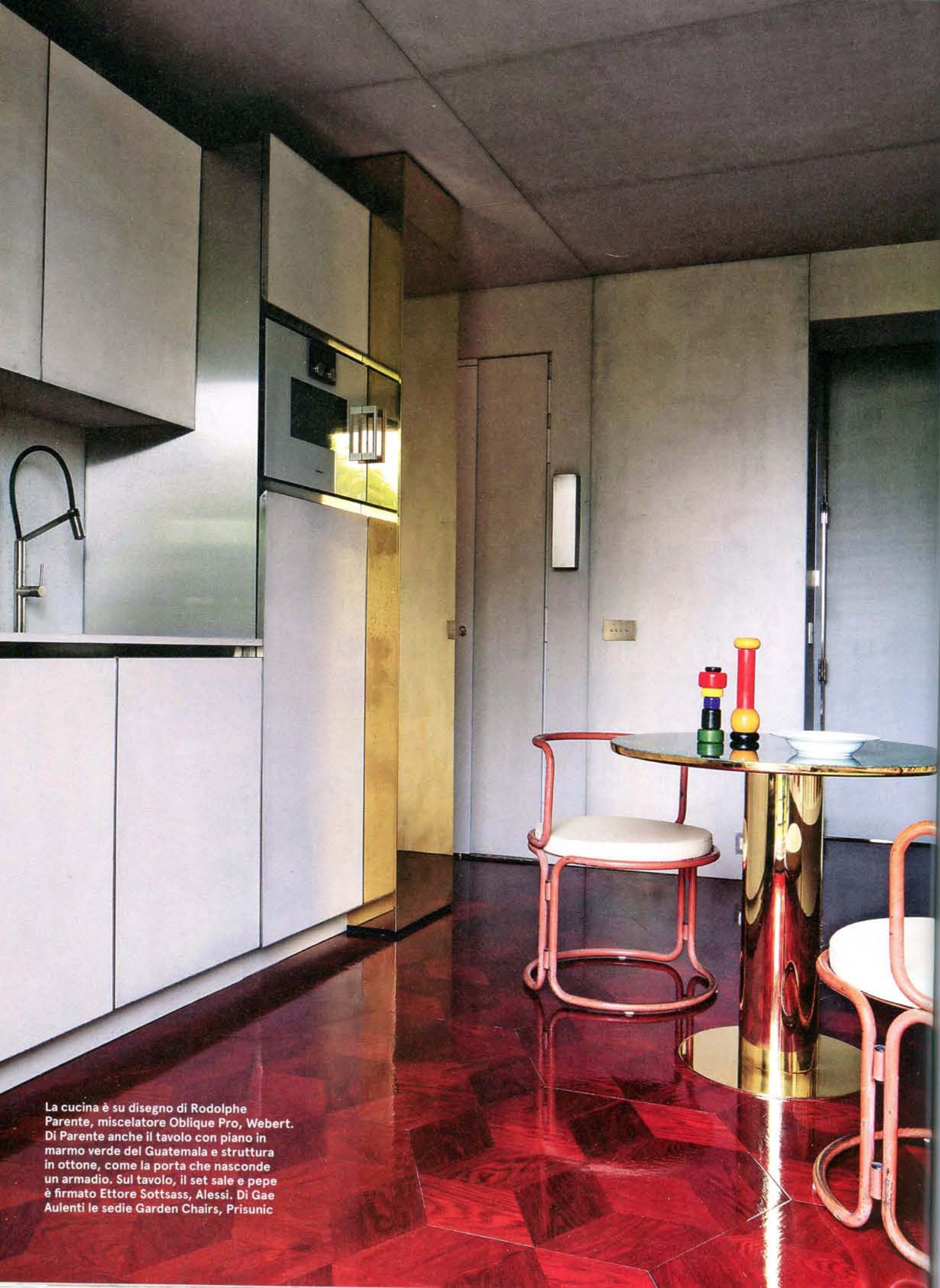
La cucina è su disegno di Rodolphe Parente, miscelatore Oblique Pro, Webert. Di Parente anche il tavolo con piano in marmo verde del Guatemala e struttura in ottone, come la porta che nasconde un armadio. Sul tavolo, il set sale e pepe è firmato Ettore Sottsass, Alessi. Di Gae Aulenti le sedie Garden Chairs, Prisunic