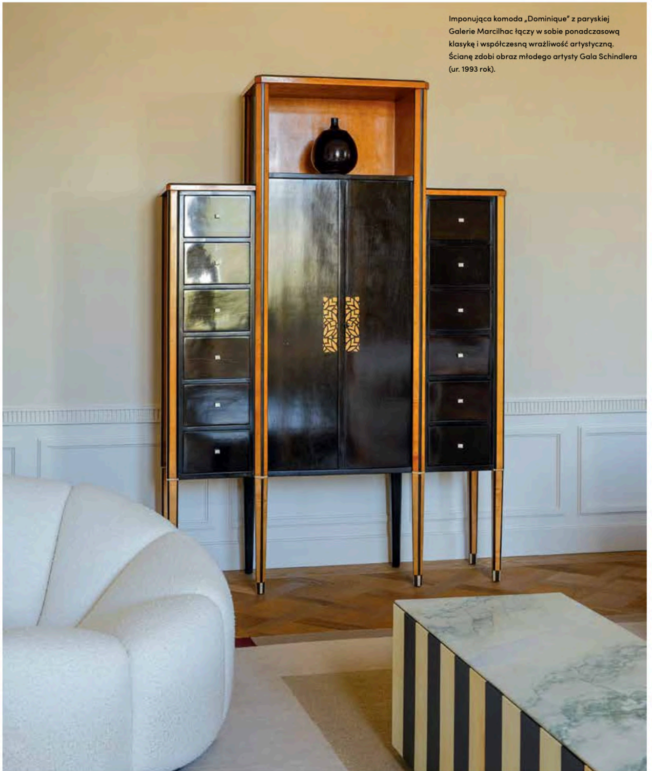
Imponująca komoda „Dominique” z paryskiej Galerie Marcihac łączy w sobie ponadczasową klasykę i współczesną wrażliwość artystyczną. Ścianę zdobi obraz młodego artysty Gala Schindlera (ur. 1993 rok).